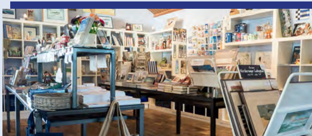
Andenken, Literatur, Plakate u.a. im Museumsshop.